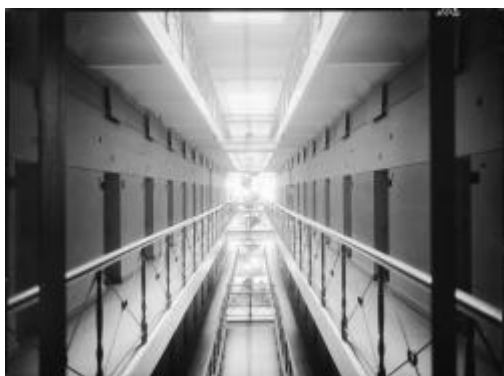
Rannsakningsfängelsets korridor. Bildnr: D6805 Foto: Foto: Okänd, 1913, SSM