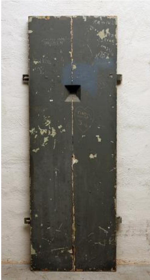
Insidan av celldörren med inskriptionerna väl synliga. Bildnr: SSM 43 643

Fängelser är för det stora flertalet av oss avlägsna och främmande platser som vi inte kommer i kontakt med annat än genom TV och tidningar. I Stadsmuseets samling finns dock ett antal föremål med vilkas hjälp vi kan närma oss den slutna fängelsemiljön. De härrör från fängelser och häkten runt om i Stockholm och ger oss en liten inblick i livet på dessa institutioner.