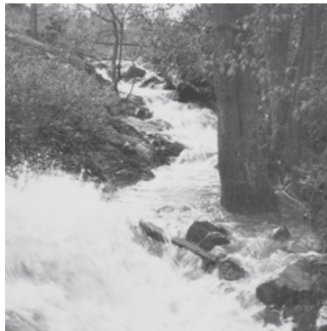
Årstaån oktober 1930

Landhöjning och vattenreglering har gjort att bäckravinen nästan torkat ut men arbeten under 2006-07 har återskapat vattenflödet.