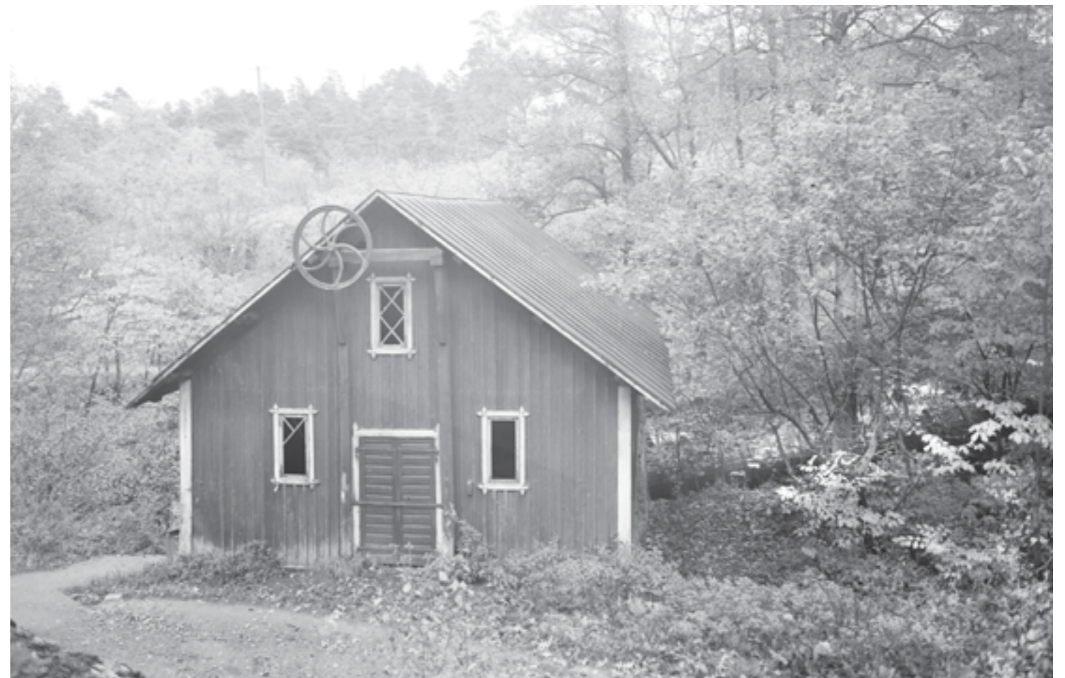
Kvarnen fanns kvar ända in på 1930-talet fast byggnaderna då var förfallna. Då stod här dels själva kvarnbyggnaden.

Gårdens placering vid Årstaviken är omsorgsfullt vald, alldeles invid ån med vattenförbindelse ut i Årstaviken och vidare till Mälaren.