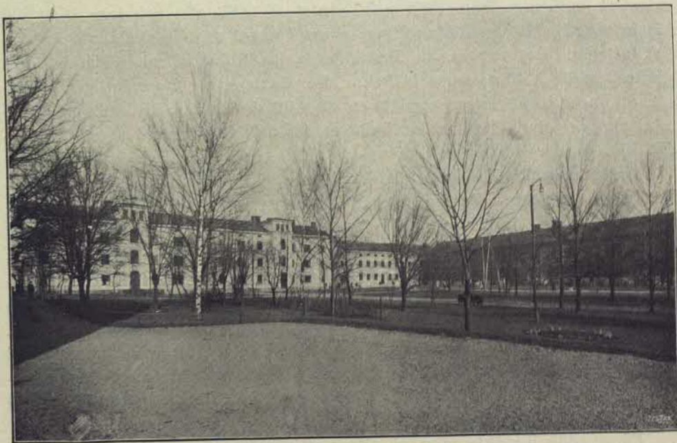
Allmänna försörjningsinrättningens hufvudbyggnader.

Förutom redan anförda byggnadsföretag kunde, om så behöfdes, en mångfald andra förändringar omnämnas, hvilka samfällt bidragit att gifva inrättningen prägel af hvad den skall vara — en barmhärtighetsanstalt.