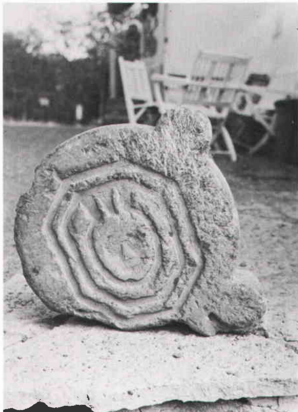
Fragment av bislagssten från Kindstugatan 4.

rundeln har också det bislagshuvud som grävdes fram vid gatuarbete i Brunnsgränd strax nedanför Österlånggatan år 1976. Här är sandstensskivan omgiven av en krans av sju runda knoppar. Hela bredden är ca 1/2 m.