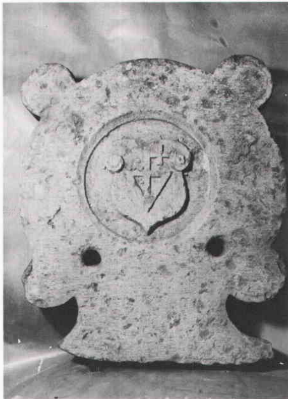
Bislagshuvud funnet i gårdsbeläggningen, Köpmangatan 11.

Den i stort sett helt bevarade bislagsstenen är nästan 2 m lång. Den påträffades 1971 vid renovering av bottenvåningen i huset Järntorgsgatan 4 och har efter kvartersnamnet kallats Medusastenen. Den långa kalkstensskivans profilhuggna kant blev efter putsavknackning på en innervägg synlig strax ovan golvnivån, där den murats in i början av 1600-talet som tröskel i en senare igensatt dörröppning.