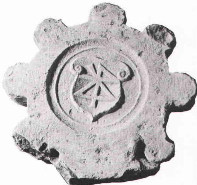
Stenfyndet från Brunnsgränd.