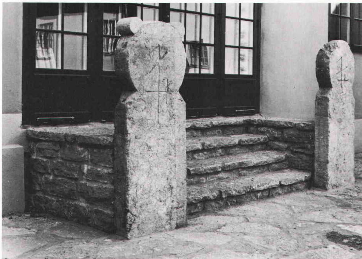
De två bislagsstolpar som efter restaurering ställts upp på Fornsalens gård i Visby.

en av stadens begravningsplatser ursprungligen varit bislagsstenar. Bislag förbjöds i Tallinn så sent som på 1830-talet. Då togs många av dem tillvara av arbetare och fattigt folk, som på det viset kom över en vacker sten för någon anhörigs grav sedan vederbörandes namn och data huggits in. Ett stort antal av stenarna i Tallinn, där bislag nämns i källor från slutet av 1400-talet, är av samma typ som Medusa-stenen. Man vet att stenhuggarhyttorna i staden, som har god tillgång på lämplig kalksten, under 1500-talet tillverkade och exporterade schablonste-