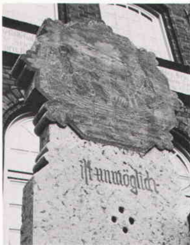
Den högra av bislagsstenarna framför Schiffergesellschafts byggnad i Lübeck, med målad bild av fiskarfänge.