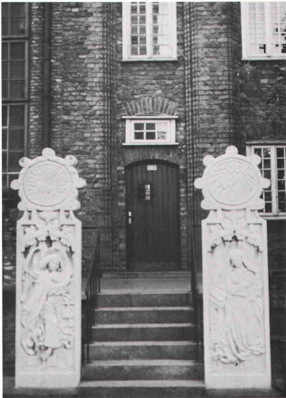
Ringbislagssten med kompletterad fot i Tallinn.