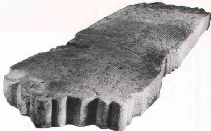
Medusastenen på stadsmuseet.

Någon mera omfattande forskning har mig veterligt inte företagits angående bislaget som byggnads- och arkitekturelement, dess uppkomst och praktis-