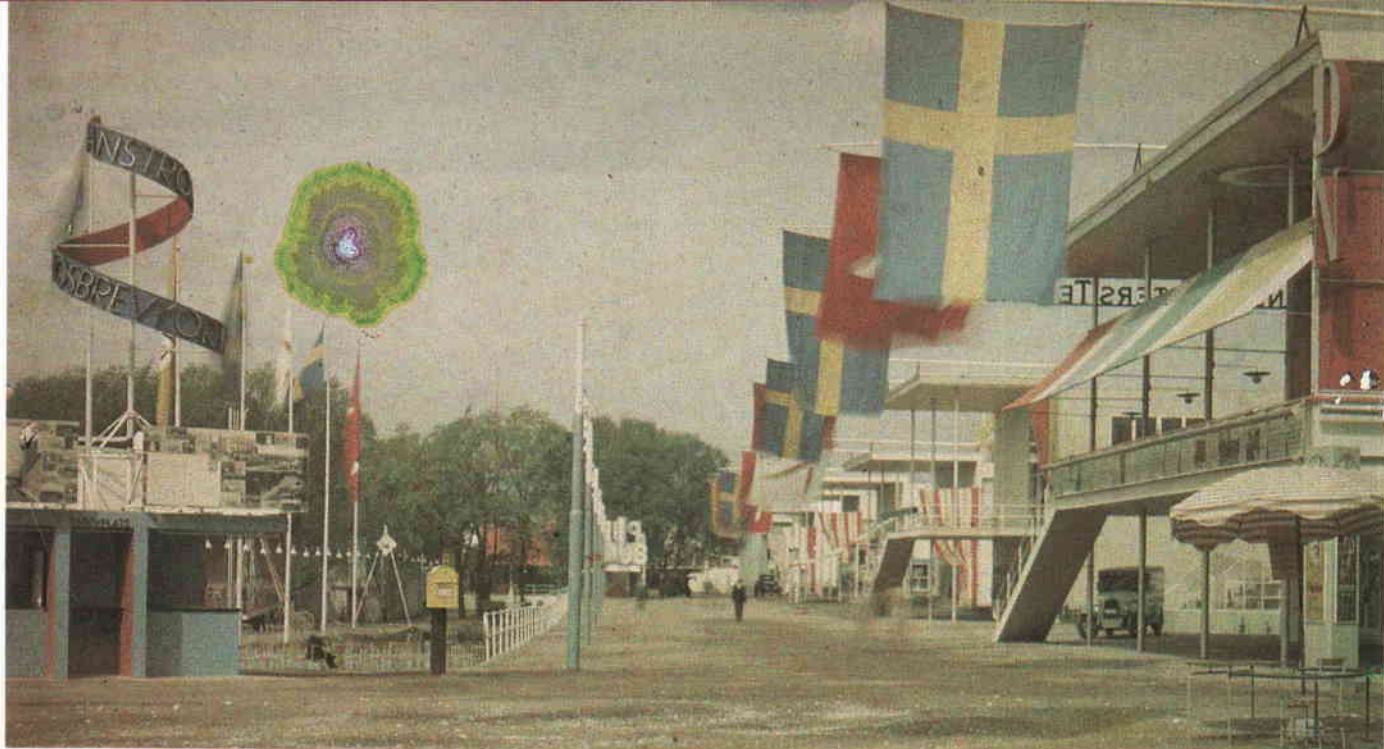
Stockholmsutställningen vid Djurgårdsbrunnsviken 1930. Autokrom