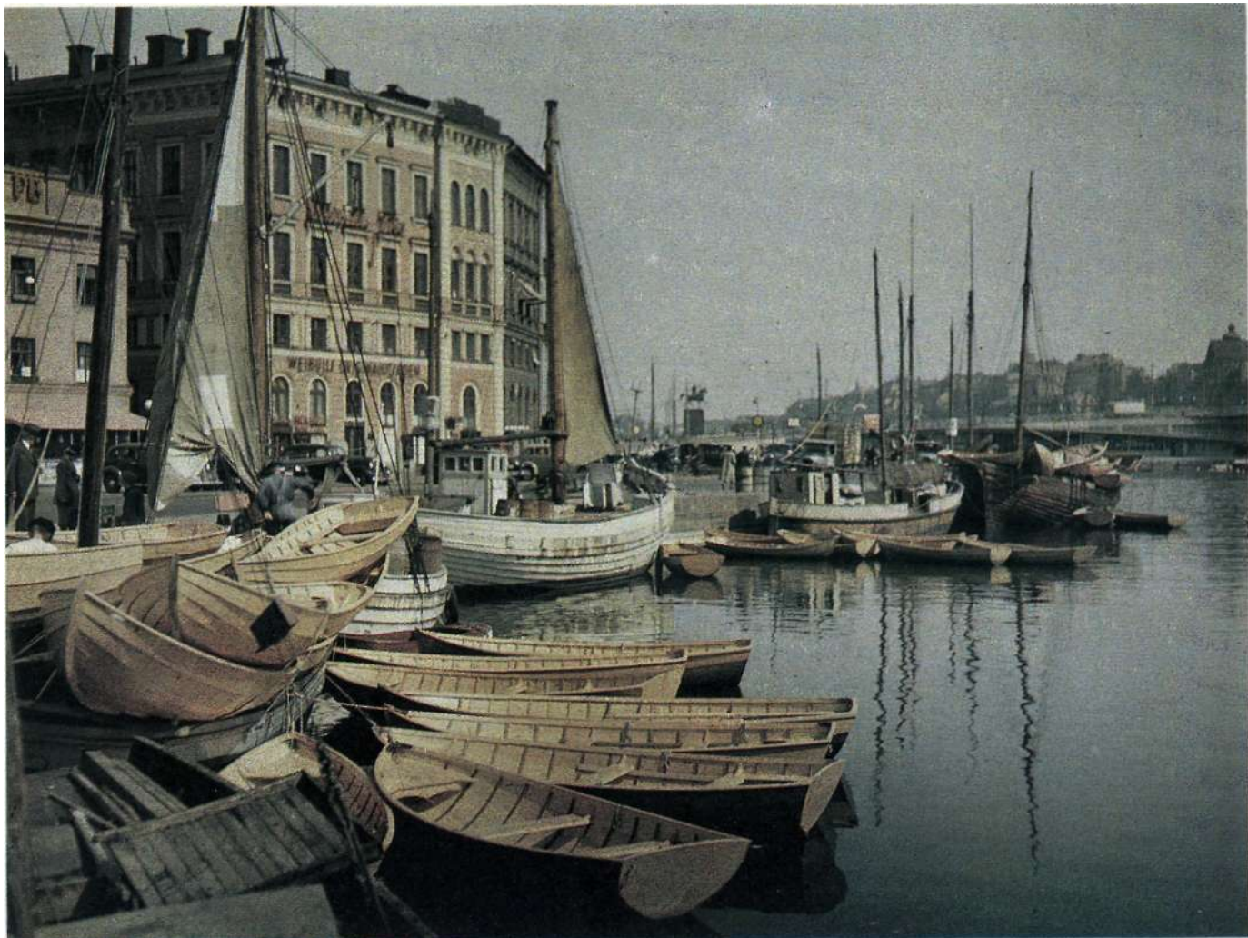
Hammen vid Mälartorget 1936. Agfa