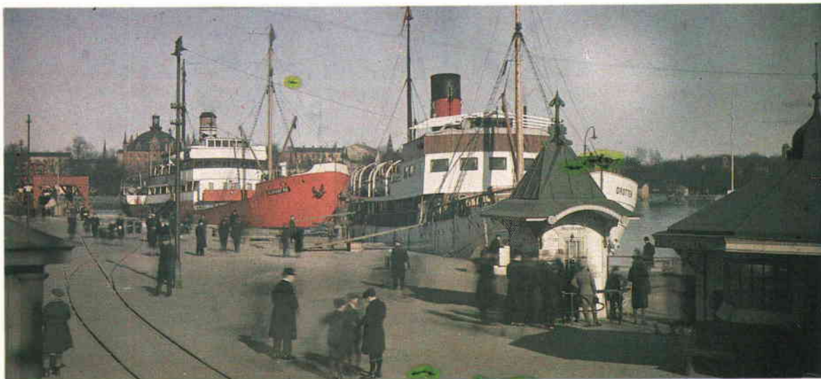
Skeppsbron vid Räntmästaretrappan. Mars 1929. Autokrom