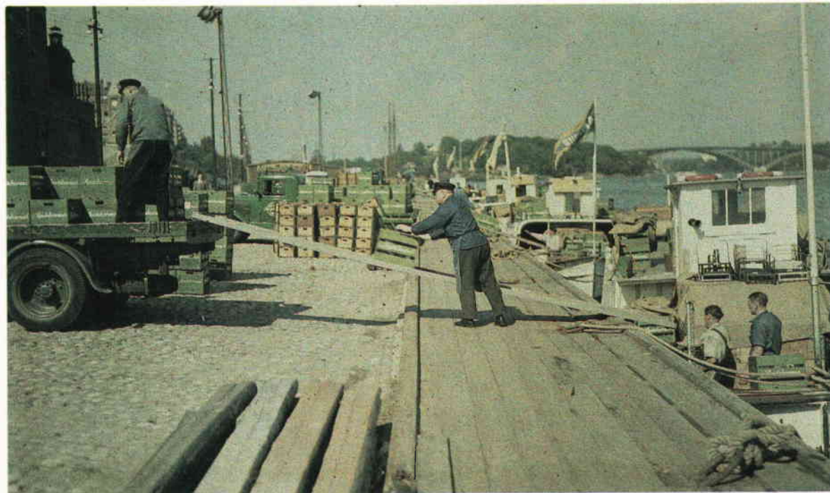
Från Söder Mälärstrand 1934. Agfa