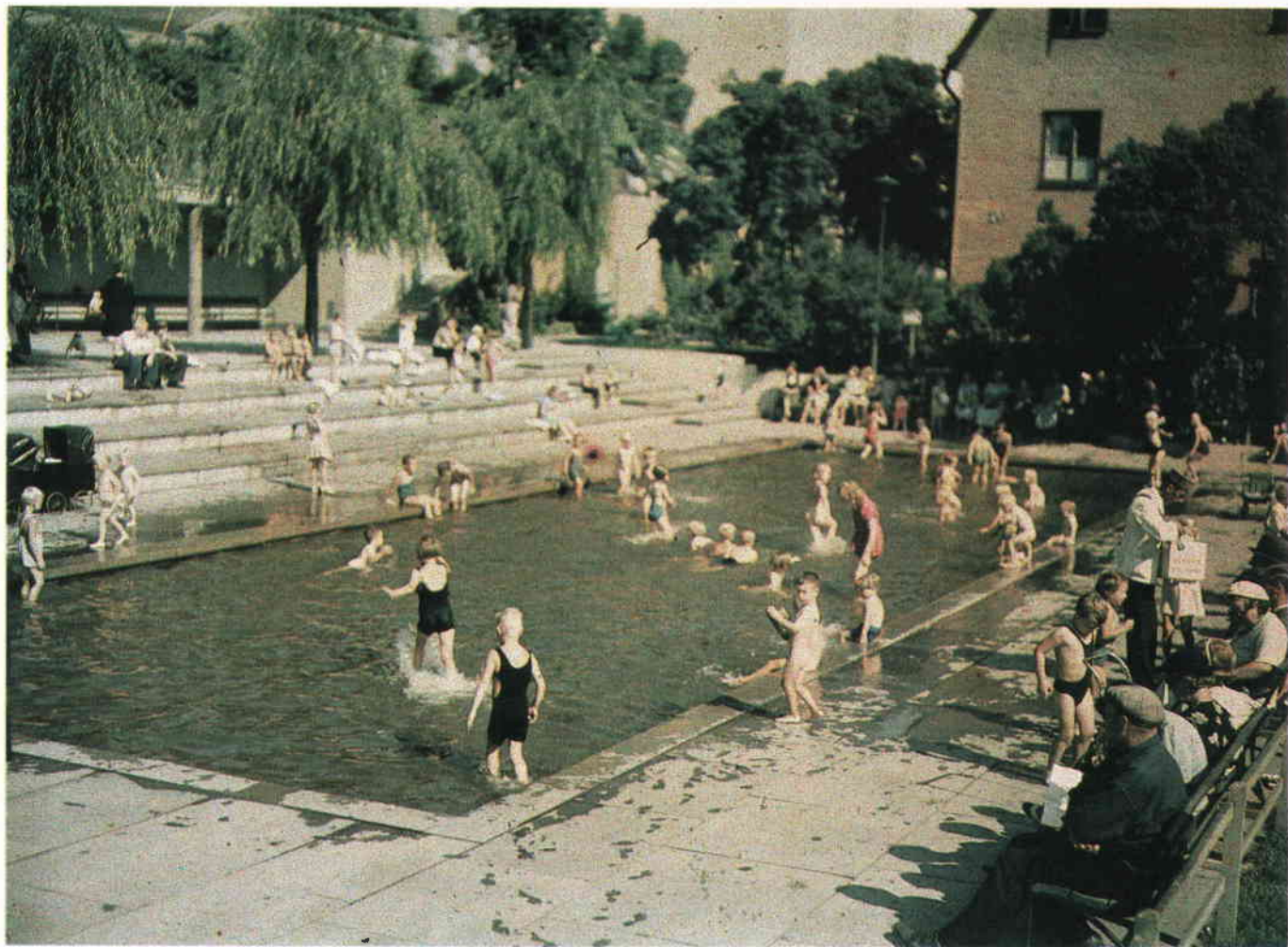
Björns trädgård vid Medborgarplatsen 1937. Agfa