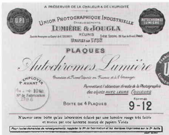
Originalförpackning från 1920-talet.

Under perioden 1907–16 var Cronquist hänvisad till Lumières autokromplåtar. 1916 lanserar Agfa sin färgplåt och strax därefter och fram till mitten av 30-talet växlar Cronquist främst mellan dessa märken. Efter 1934, då Agfa presenterar sin Agfa Ultra plåt använder Cronquist mest denna på grund av dess större transparens.