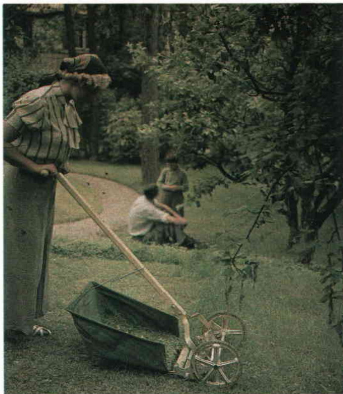
Gräsklippning i Äppelviken 1937. Agfa