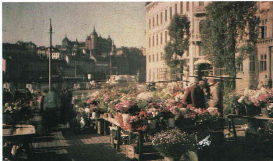
Blomsterstånd vid Kornhamnstorg 1926. Autokrom