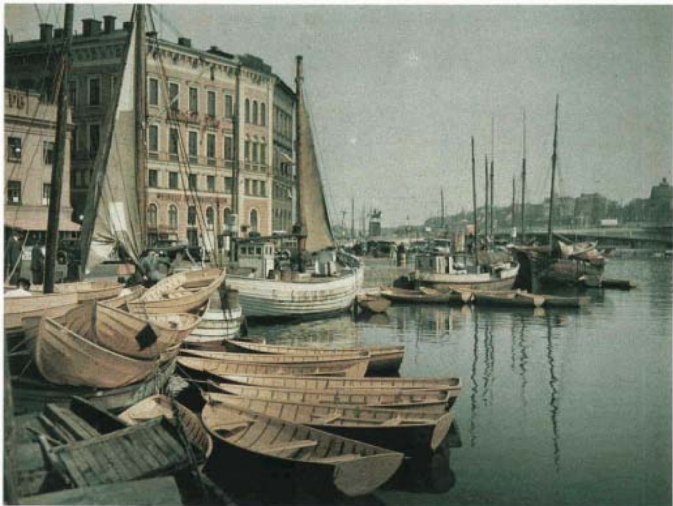
Hamnen vid Mälartorget 1936. Agfa