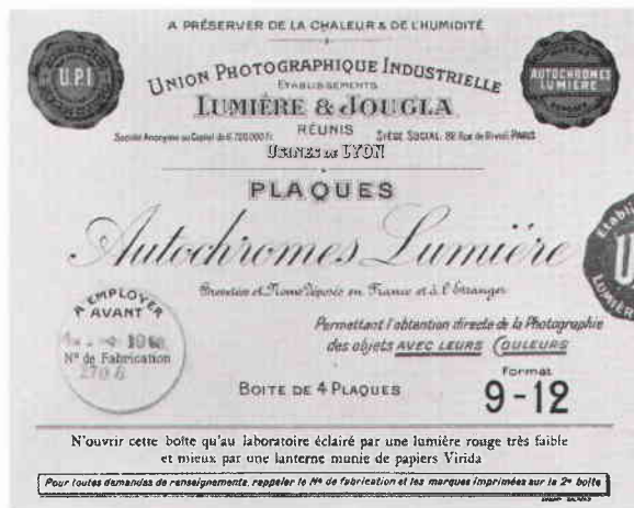
Originalförpackning från 1920-talet.

Under perioden 1907–16 var Cronquist hänvisad till Lumières autokromplåtar. 1916 lanserar Agfa sin färgplåt och strax därefter och fram till mitten av 30-talet växlar Cronquist främst mellan dessa märken. Efter 1934, då Agfa presenterar sin Agfa Ultra plåt använder Cronquist mest denna på grund av dess större transparens.