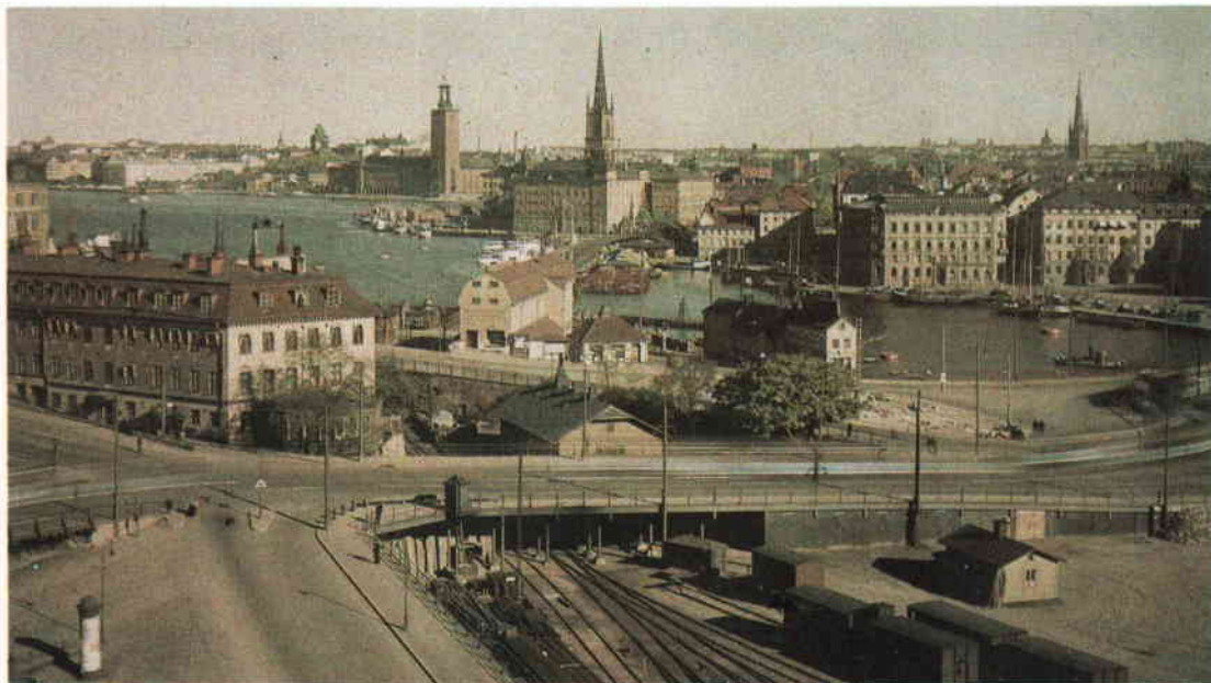
Utsikt från Cronquists våning vid Stadsgården 1928. Autokrom