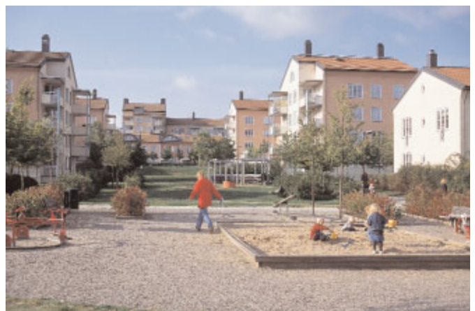
Trädskolan , Enskede Gård. Här, på platsen för stadens gamla plantskola, har Brunnberg & Forshed skapat en tät liten stad med låga radhus, lamellhus och något högre punkthus kring ett centralt långsmalt parkstråk. Foto Göran Fredriksson, 2001.