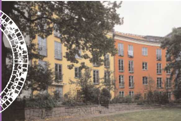
Sankt Eriksområdet har av många stämplats som pastisch men är enligt arkitekterna själva "ett försök att utveckla klassicismen". I bågen har man satsat på linoljefärgsmålade träfönster, en kvalitet man är ovan vid i det sena 1900-talets nybyggande.