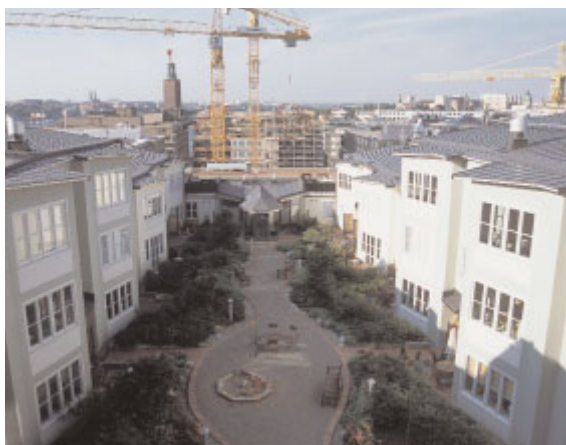
Wahrenberg 11. Vy mot väster från den gård som skapats uppe på taket på P-huset i City. I fonden syns byggnaderna som är i full gång med att förvandla också P-huset Elefanten till bostäder.