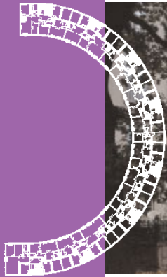
Sankt Erik , planlösningen i östra bågen.