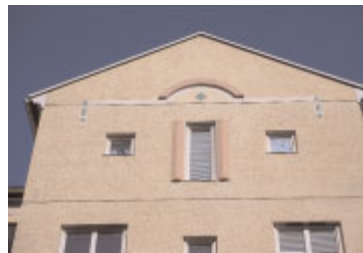
Minneberg . En för området typisk gavel med dekorativt mönster av lätta fiberbetongdelar och små kakelplattor i olika färger.