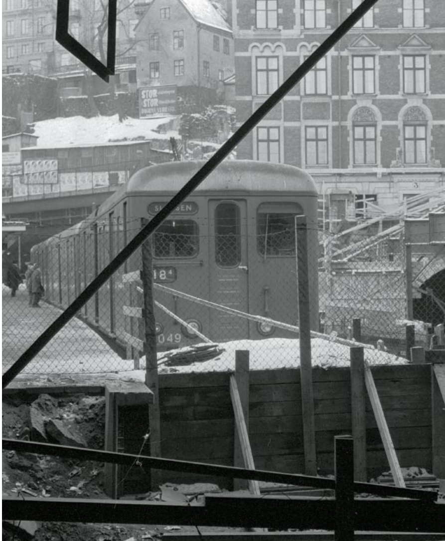
»Slussen: genom den här bråten kommer T-banan att fortsätta via Söder-Strömbron och Riddarholmskanalen till Tegelbacken.« Till höger – under dåvarande Stockholms sjömanshem – syns mynningen till den gamla järnvägstunneln mot Södra station. Foto: John Kjellström, SVD, 8 februari 1956.

S amhällsplaneringen inriktades på att anpassa staden för en enligt prognoserna ökande bilism av nästan oanade dimensioner. I Stockholm var parkeringsproblemen så svåra att införandet av en sorts kommunal bilskatt diskuterades. Den nya, parallella Danviksbron invigdes och ytterligare ett litet steg mot det nya bilsamhället var öppnandet av Stockholms första motell »Gyllene Ratten« invid Södertäljevägen. (Revs i år.)