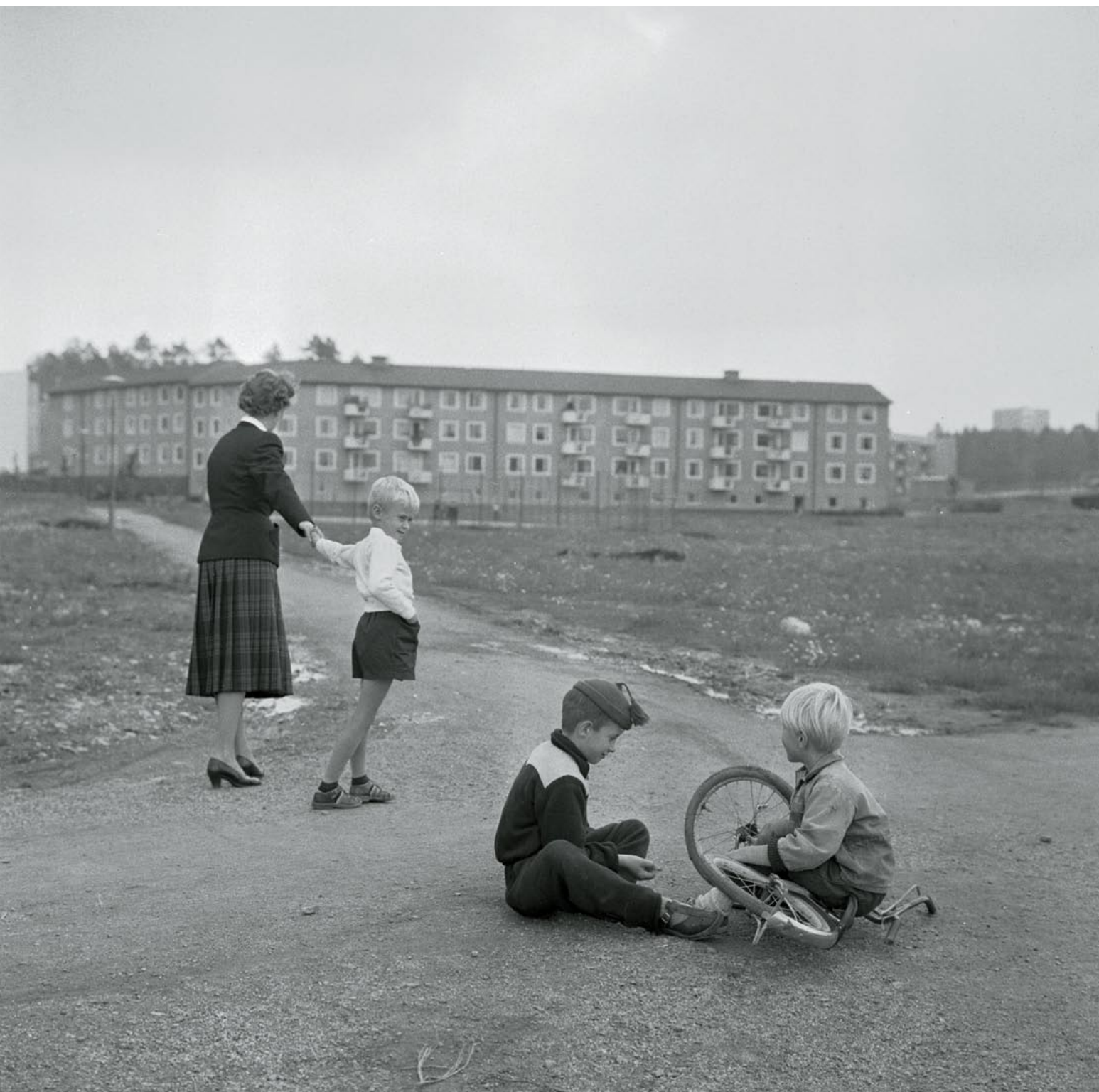
Skolstart för nybörjare i Vällingby. Foto: Jan Ehnemark, SvD, 30 augusti 1956.