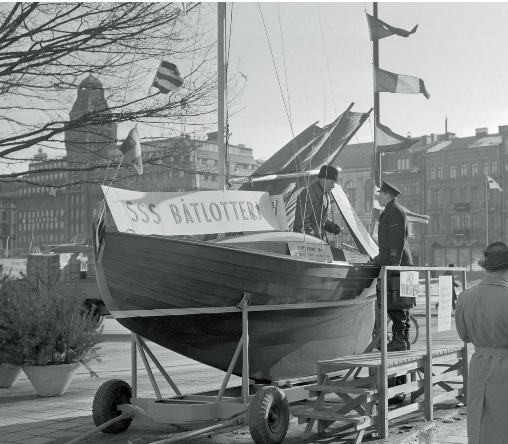
Stockholms Segelsällskaps båtlotteri på Nybroplan var ett värtecken som fick stockholmarna att börja drömma om en kommande sommar. 20 mars 1956.