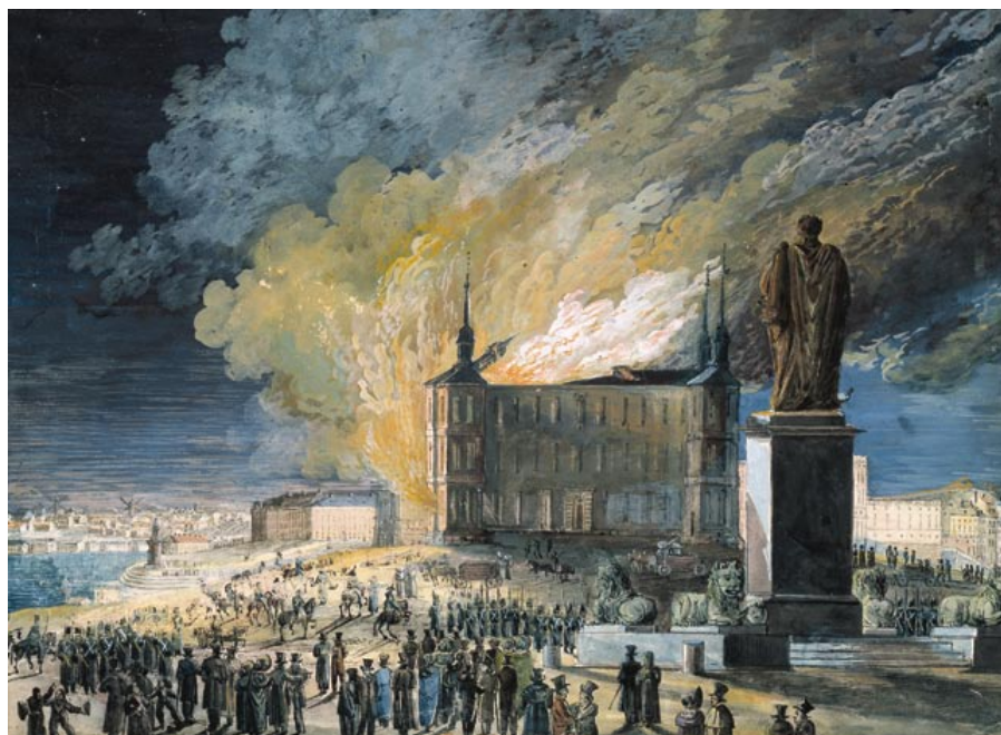
Palatset Makalös brand 24 november 1825. Målning av Axel Fredrik Cederholm, Stockholms stadsmuseums samlingar.