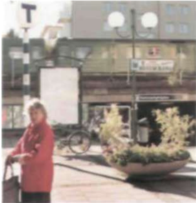
1958 öppnade tunnelbanan till Hammarbyhöjden och restiden in till centrala Stockholm förkortades betydligt.

Kommunikationerna fungerade till en början inte heller så bra. På de stora arbetsplatserna vid Skanstull och Södra Hammarbyhamnen var det inte många hammarbybor som arbetade, utan de flesta hade sina arbeten på andra håll. Från början var spårvagnslinjerna 18 och 19 de enda förbindelserna med centrala Stockholm. Senare kom en busslinje som gick in till Brunkebergstorg men under krigsåren minskade turtätheten pga bränsleransonering vilket gjorde att många istället cyklade.