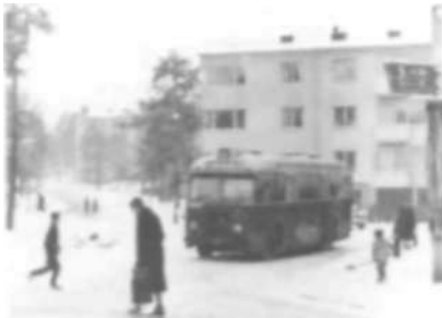
Finn Malmgrens Plan 1956.