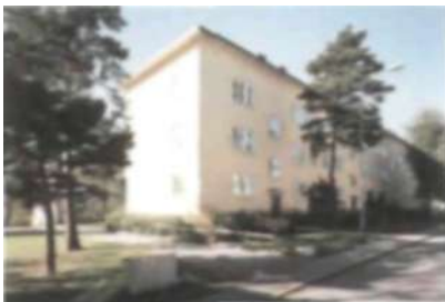
Hasselquistvägen 10-16, ett av Stockholms vackraste hus enligt en artikelserie i Dagens Nyheter 1994-95.