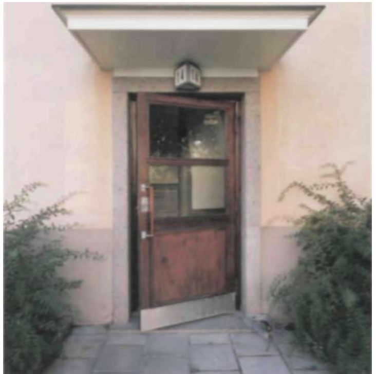
De ursprungliga entrédörrarna har renoverats.

Alla tak fick ny papp, gavlarna tilläggsisolerades invändigt och de lägenhetsskiljande väggarna ljudisolerades. Två nya tvättstugor iordningställdes och de befintliga renoverades.