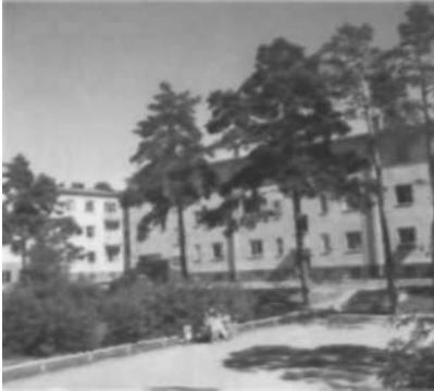
Några stenar i en park vid Solandergatan visat avrättningsplatsen låg.