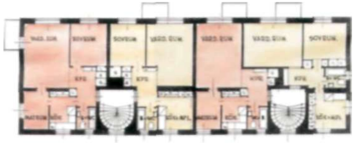
Plan över Ulricehamnsvägen 38-40 i södra Hammarbyhöjden. Smalhuslägenheterna är ofta små men välplanerade och förvånansvärt lätta att möblera trots sina små mått.

När smalhusen började byggas ansågs två rum och kök vara en bra familjebostad. I dag anses den mer lagom för en eller högst två personer.