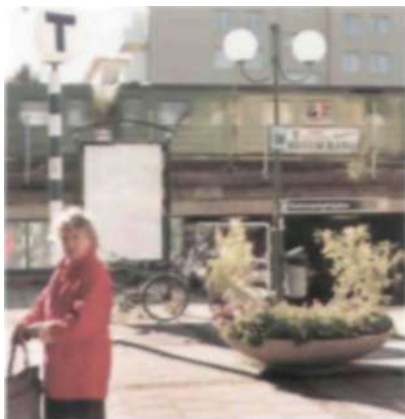
1958 öppnade tunnelbanan till Hammarbyhöjden och restiden in till centrala Stockholm förkortades betydligt.