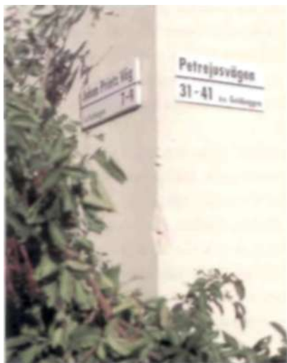
Många kulturpersonligheter har givit namn åt gator i norra Hammarbyhöjden.