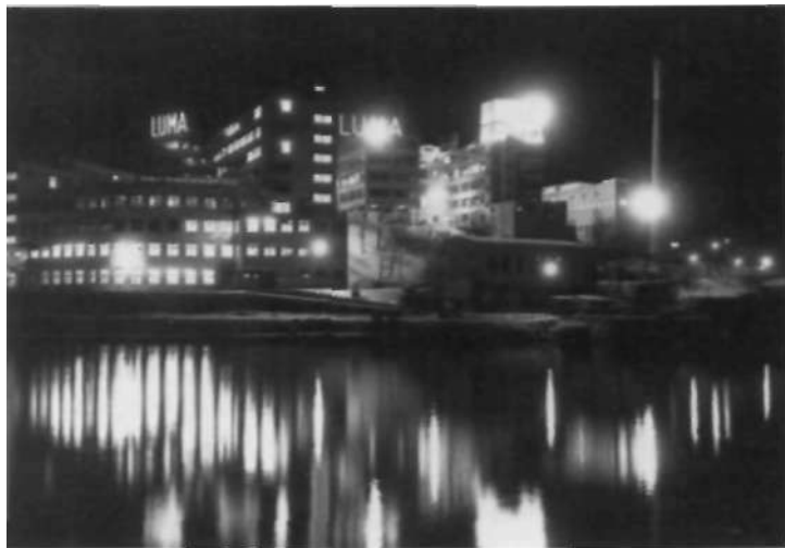
Lumafabriken i Södra Hammarbyhamnen byggdes nära den plats där Hammarby gård låg till 1945.