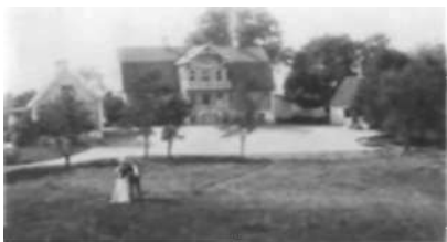
Hammarby gård 1892.

Området kring Hammarbyhöjden och Gullmarsplan var fram till mitten av 1930-talet rena landet. Där låg bondgårdar, koloniområden och handelsträdgårdar. Strax öster om Gullmarsplan låg lantvärnsskyrkogården där offren från de sista koleraepidemierna under första hälften av 1800-talet begravdes.