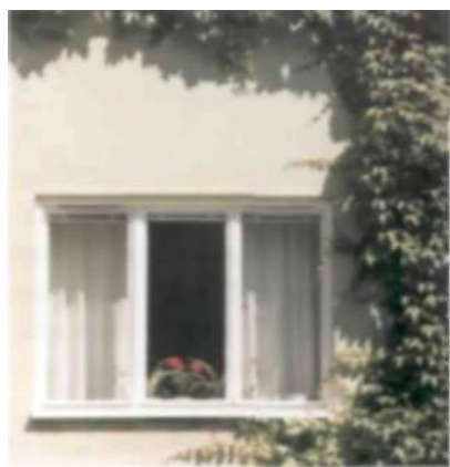
Fönstren placerade i fasadliv är stora och utan spröjs. I Stockholms hus i norra Hammarbyhöjden är alla innerrutor numera av s k energiglas.

Ända sedan sekelskiftet var trångboddheten i Stockholm mycket stor, speciellt bland barnfamiljer. 1933 utarbetade socialdemokraterna ett krisprogram. Man beslutade om statliga åtgärder för att stödja byggnadsverksamheten och att öka bostadsbyggandet.