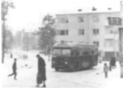
Finn Malmgrens Plan 1956.