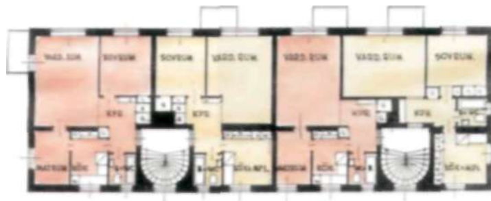
Plan över Ulricehamnsvägen 38-40 i södra Hammarbyhöjden. Smalhuslägenheterna är ofta små men välplanerade och förvånansvärt lätta att möblera trots sina små mått.

När smalhusen började byggas ansågs två rum och kök vara en bra familjebostad. I dag anses den mer lagom för en eller högst två personer.