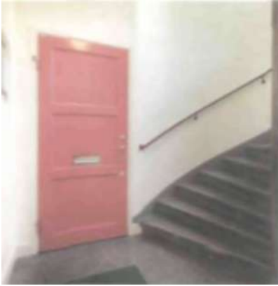
Al/a lägenhetsdörrar har bytts ut mot nya säkerhetsdörrar liknande de gamla.