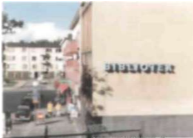
Finn Malmgrens Plan har idag både bibliotek, butiker och restauranger.

Hammarbyhöjden utgör en värdefull kulturmiljö vilket ställer krav på hänsyn vid utformningen av nya hus. De måste i skala, fasadmaterial och detaljutformning anpassas till den äldre bebyggelsen. Äldre hus får inte förändras genom t ex utvändigt tilläggsisolering, nya tak- och fasadmaterial mm, utan ska bevaras eller möjligen förnyas men med ursprungligt utseende och utförande även vad gäller detaljer.