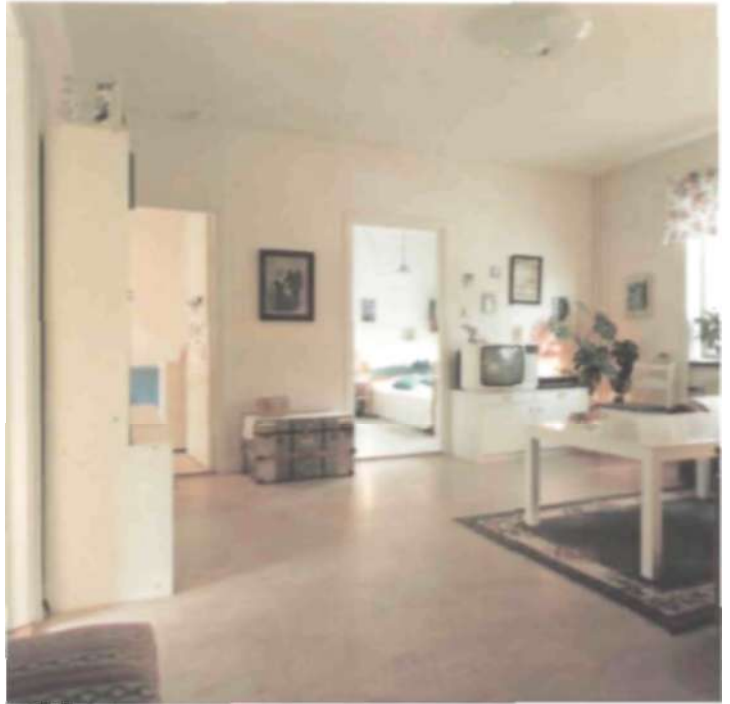
Lägenheterna är ljusa och välplanerade med bra runssamband och utblickar, både inom lägeheten och mot omgivningen.