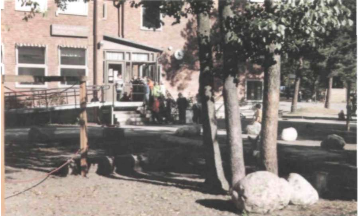
Hammarbyskolan som åter öppnade 1989 har läsåret 1998/99 ca 250 elever i årskurserna 0-5.