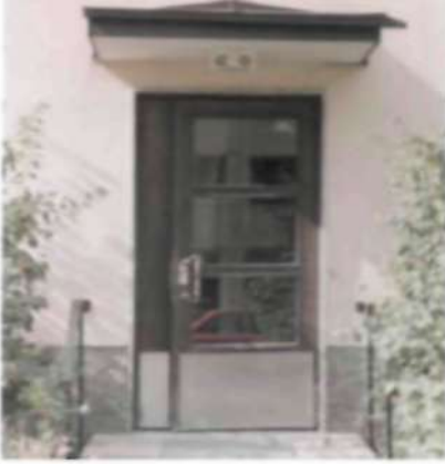
Miljön kring entréerna på Ulricehamnsvägen förbättrades 1990 med bl a trappräcken och ny plattsättning.