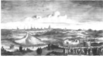
Kopparstick föreställande avrättningen av baron Georg Henrik von Görzt vid Galgbacken.