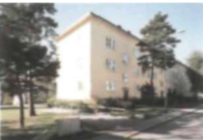
Hasselquistvägen 10-16, ett av Stockholms vackraste hus enligt en artikelserie i Dagens Nyheter 1994-95.