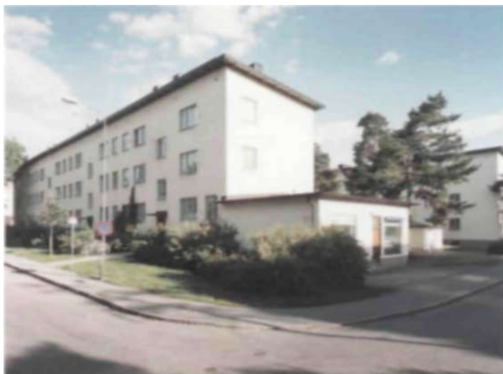
Smalhusen har ofta flacka pulpettak och släta putsade fasader.