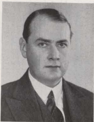
O. S. W. ORRE Sekreterare och ombudsman 22 / 1 1933 —