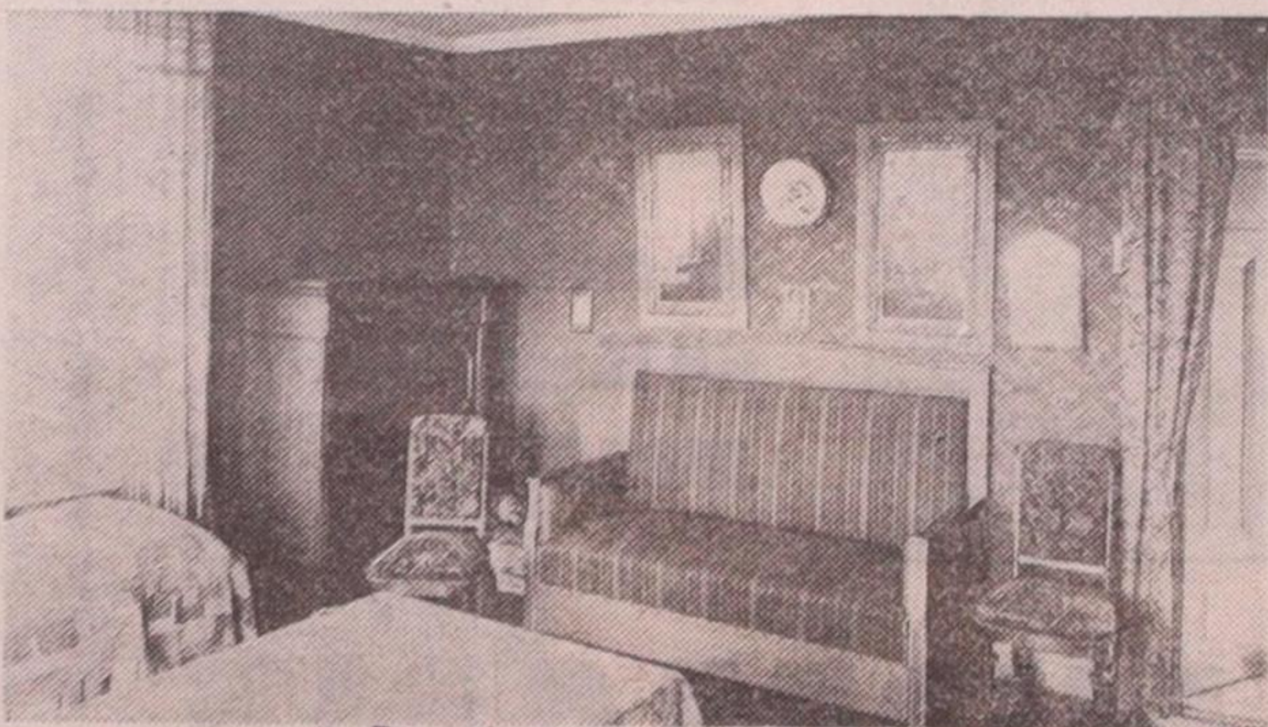
• Rum på nedre botten i Storgården.