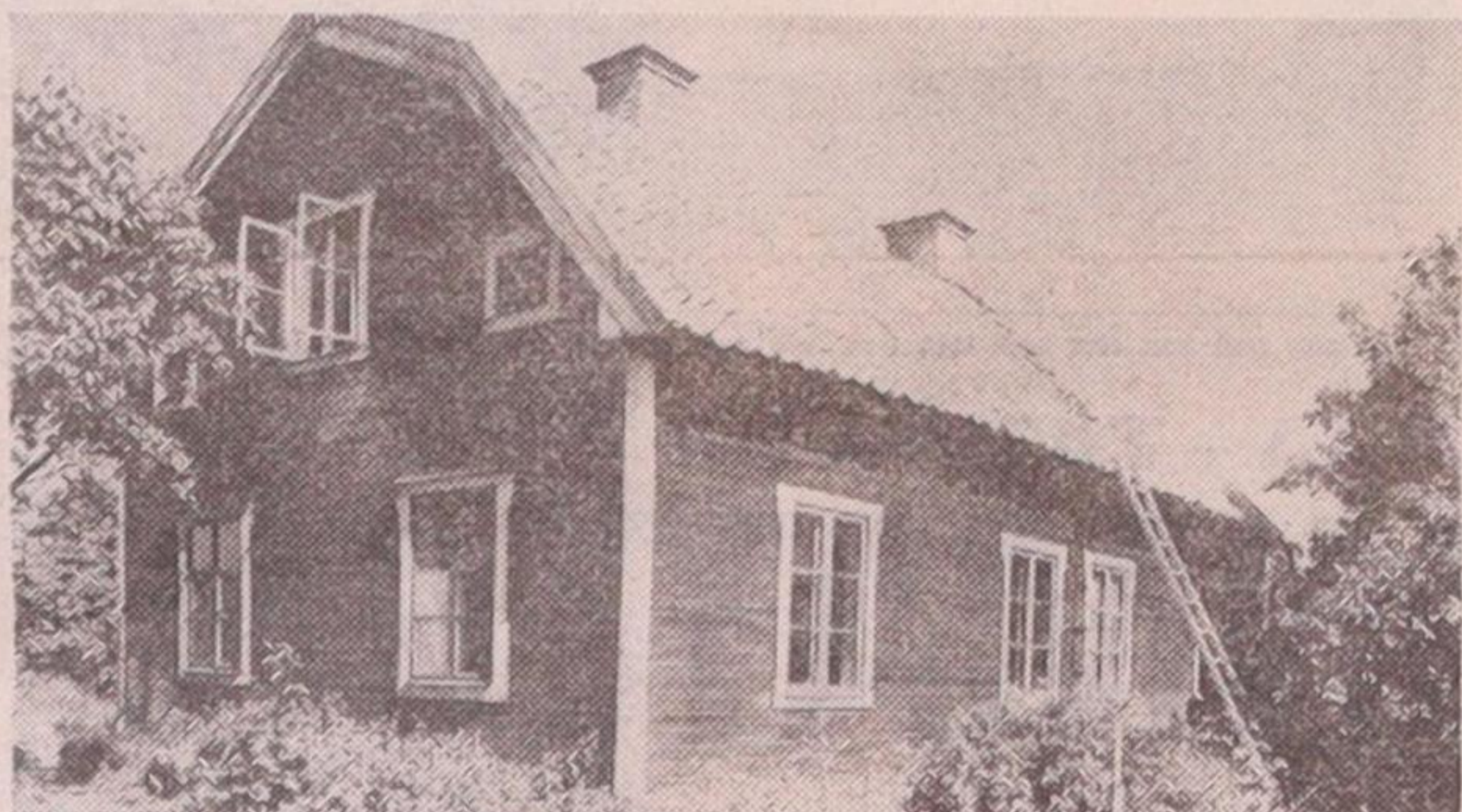
• Stadsmuseet fotograferade de gamla Vällingbygårdarna innan de revs — här är Storgården. Nu ligger Vällingbyposten här.

rat till makterna, för god växtlighet och sjukdomsbot till exempel. Blocken och stenarna finns kvar, fast de senares läge ändrats något. Älvkvarnsstenar finns på flera järnåldersgravfält. I Mälardalen, bl a på Björkö. Vid Vittangigatans början kan ni se stenarna.