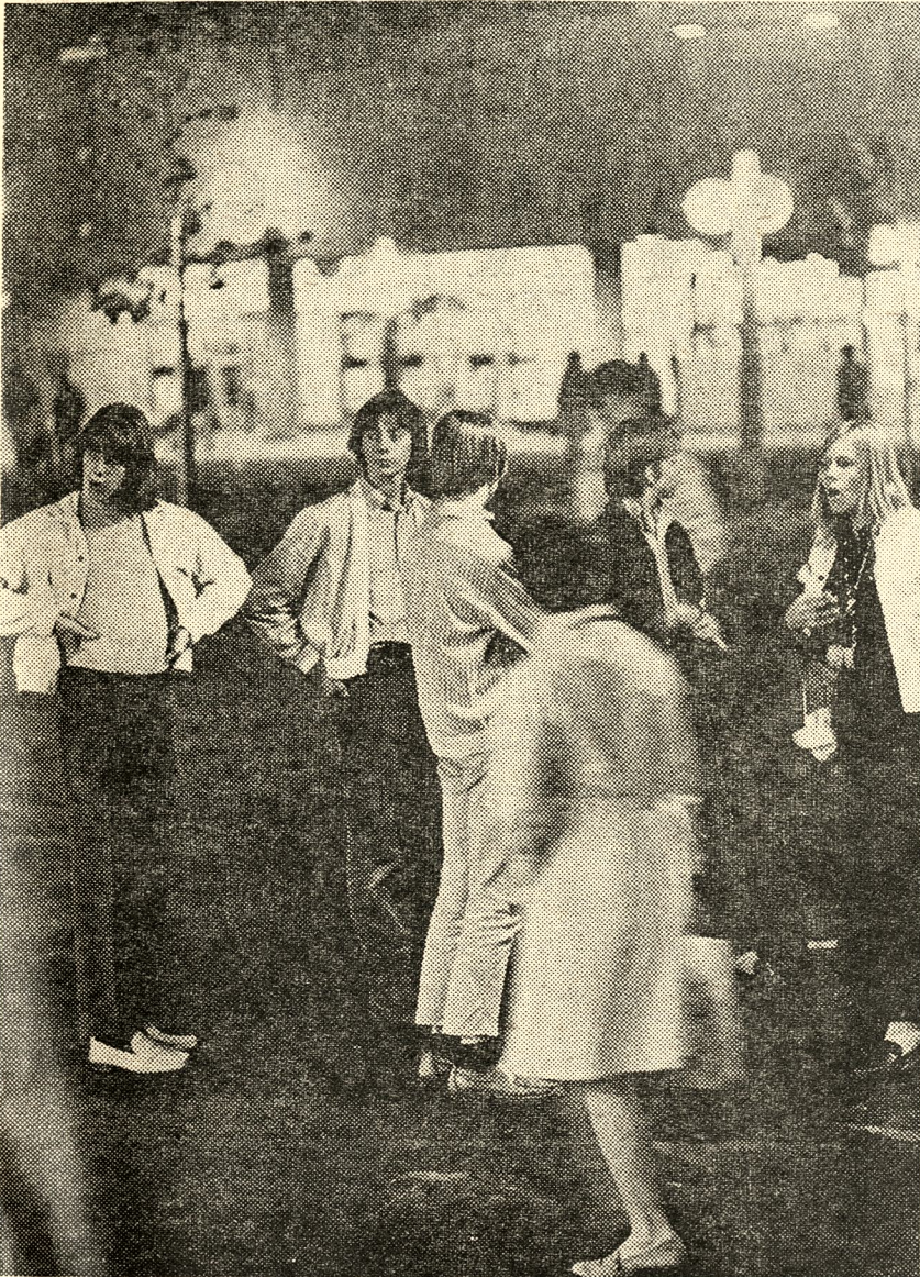
Efter två år i Skärholmen är en provisorisk ungdomsgård i en konstsalong allt de har. Den riktiga blir klar någon gång i början av 1969, vid årsskiftet eller 1 april eller ... De är hövliga, sansade men resignerade.