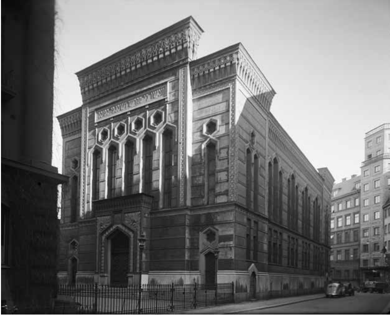
Synagogan, Wahrendorffsgatan 3, 1943.

ligt synligt i huvudstaden, men den färdiga byggnaden kom att tala tillräckligt tydligt. Mosaiska församlingen hade anställt Fredrik Wilhelm Scholander, Sveriges mest kända arkitekt, för att rita den nya synagogan. Den icke-judiska arkitekten valde en design som flörtade med samtidens intresse för pågående utgrävningar i Mellanöstern. Synagogan konstruerades som en rektangulär byggnad med raka linjer, prydd med smala fönster, ett dekorativt rosettfönster åt öster och ett utstående, detaljrikt tak. Tidningarna beskrev synagogan som ett "stätlig[t] andaktshus" och "ett af de intressantaste och skönaste monumentala byggnadsverk som un-