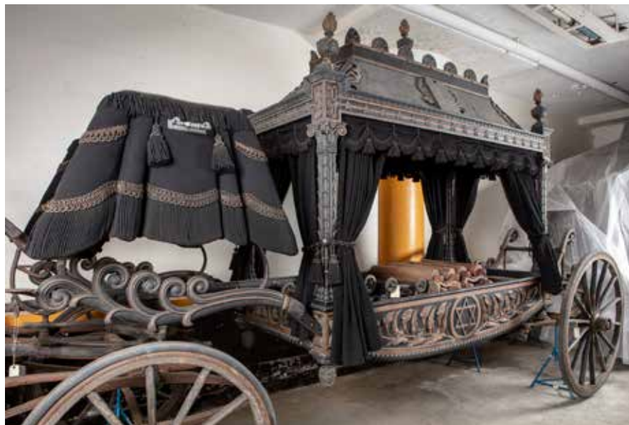
Mosaiska församlingens begravningsvagn från 1840-talet. Finns bevarad i Stads- museet i Stockholms samlingar.