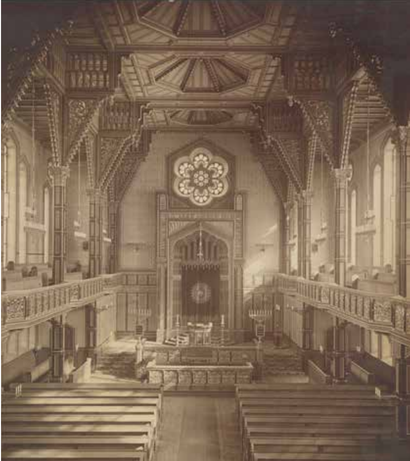
Interiör av synagogan på Wahrendorffsgatan